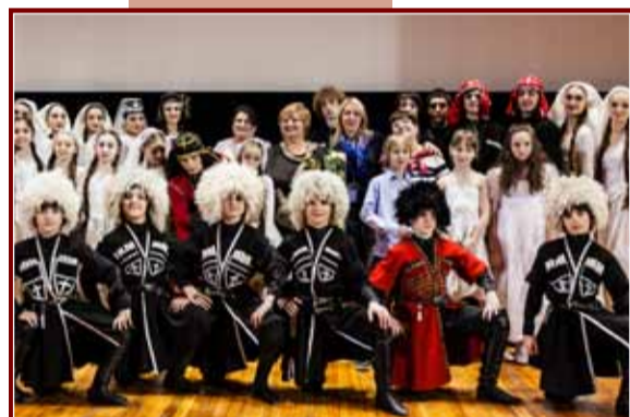
Участники гала-концерта Всероссийского инновационного детско-юношеского фестиваля «100 городов России» (реж. — Мария Гарелина). Москва, 2013