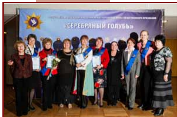
Лауреаты Международного знака общественного признания «Серебряный голубь» — представители разных стран мира. Москва, 2013